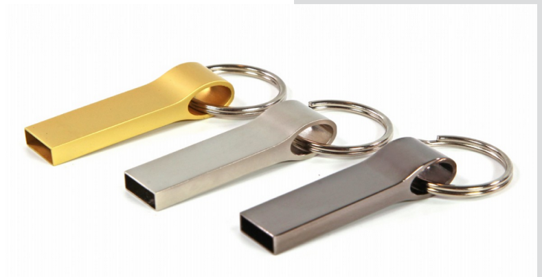
Abbildung Maßstab 1:1